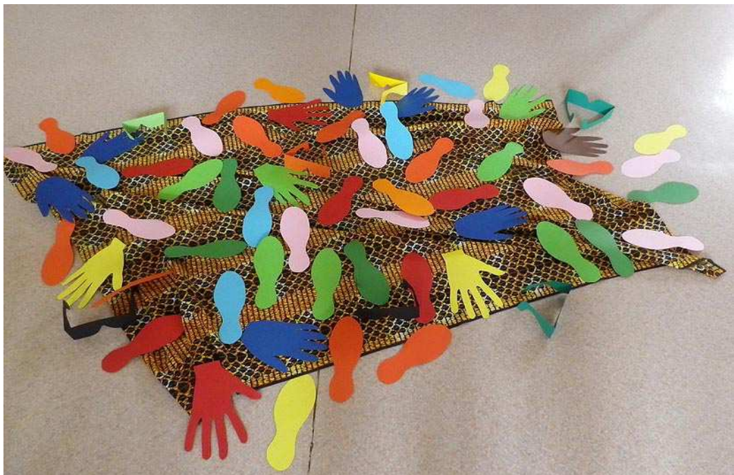
Symboles - mains et pieds - préparés par la Belgique pour une liturgie.