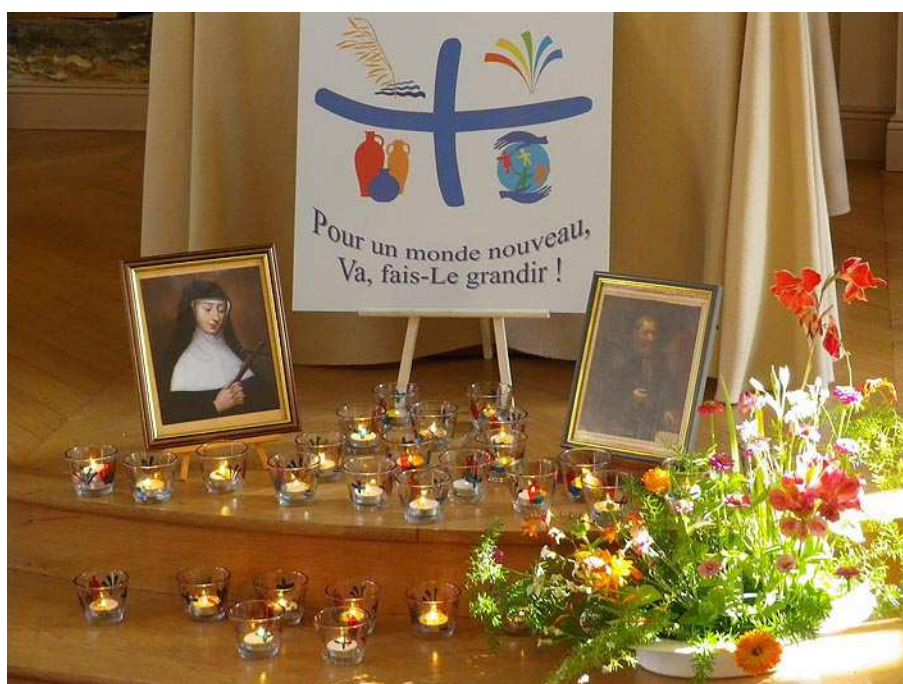
Notre mission, depuis l'origine : « Fais-Le grandir. »