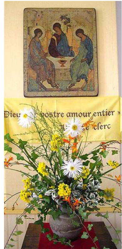
En salle du Chapitre : l'icône de la Trinité et un foulard jaune « Alix » du 4 e centenaire.

Au cours du mandat, sera organisée une rencontre internationale réunissant des délégués des sœurs et des laïcs, pour faire le point sur notre mission commune et se donner de nouvelles orientations. ■