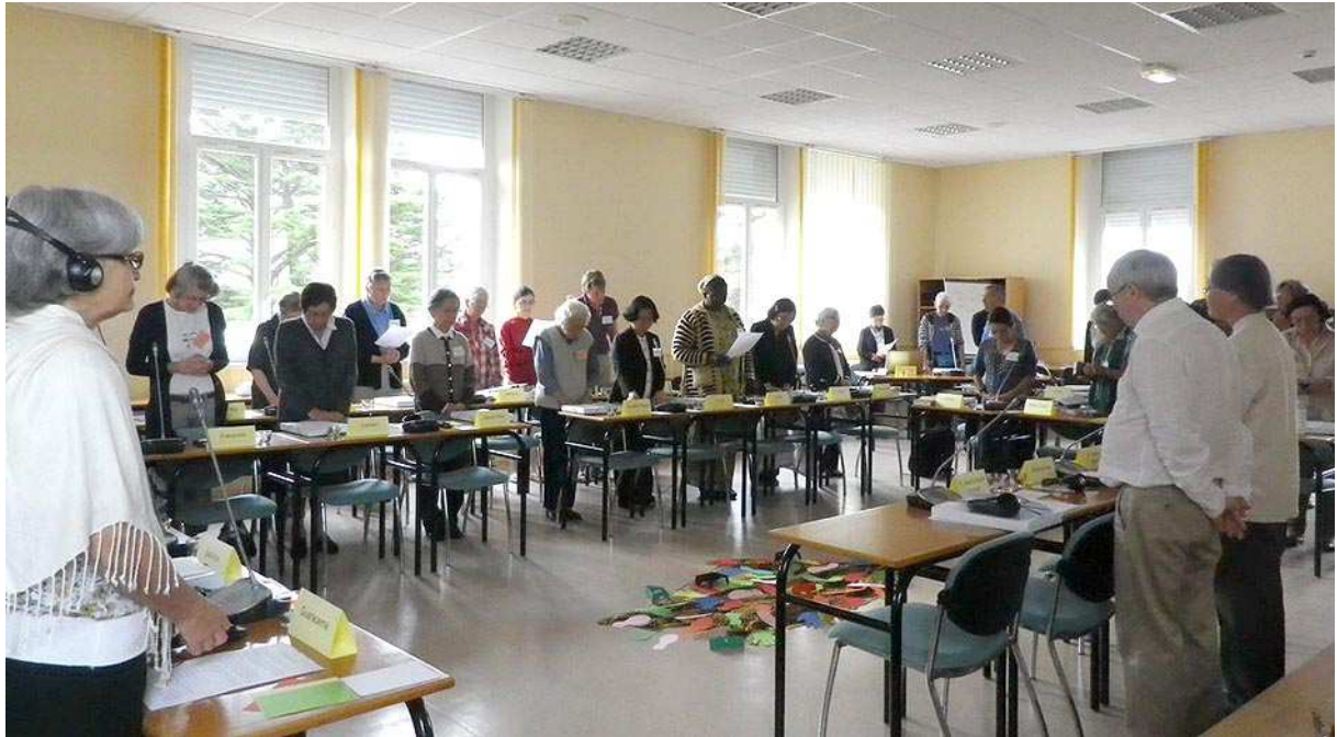
Prière du matin en salle du Chapitre.

La formation ne concerne pas seulement la formation initiale. Nous sommes toutes appelées, à la suite du Christ, à nous laisser former.