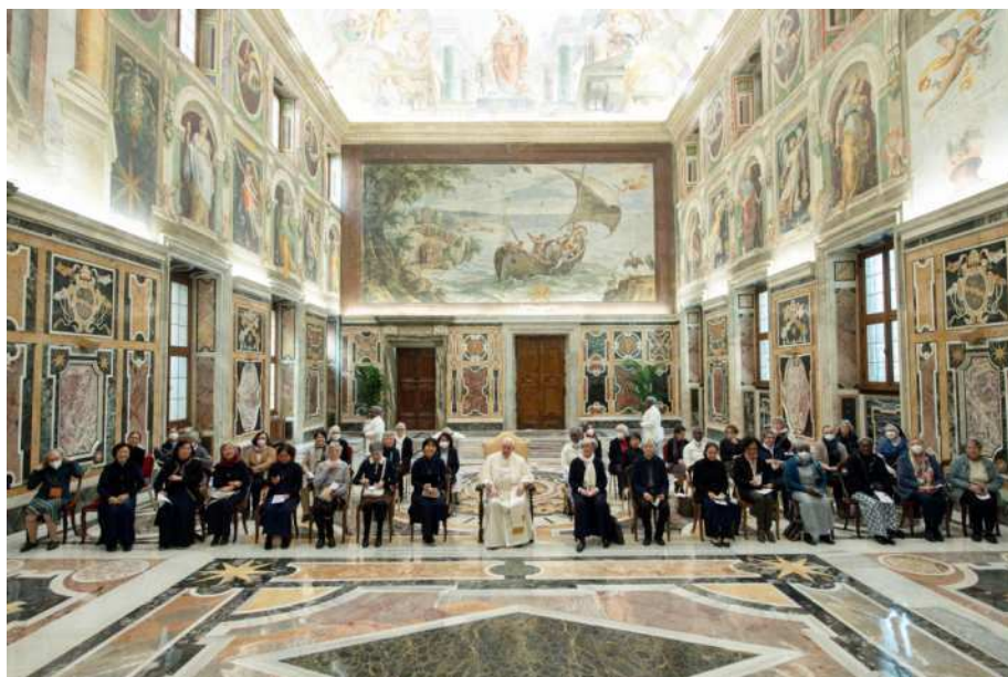
24 janvier 2022 – Salle Clémentine