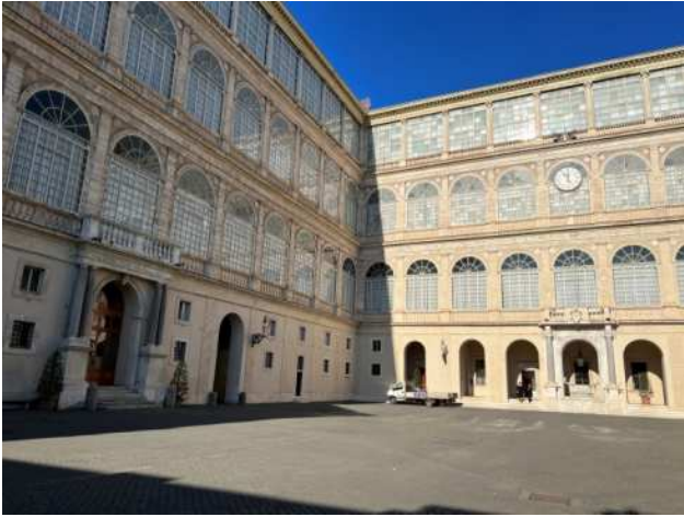
Cour Saint Damase