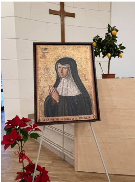
Salle du Chapitre