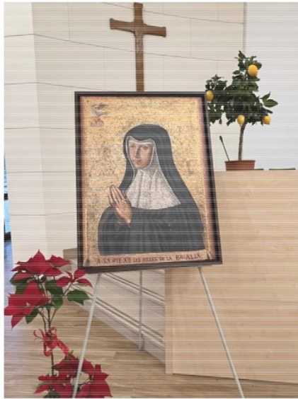
Salle du Chapitre