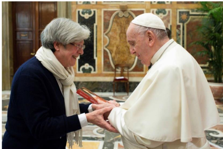
Remise des Ecris Spirituels de Mère Alix