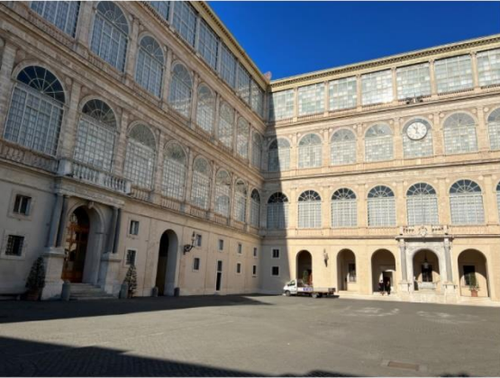
Cour Saint Damase