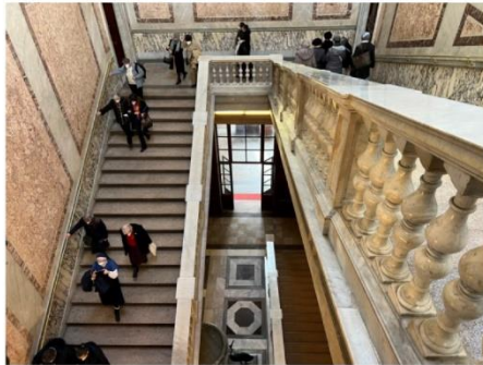
Escalier de la Porte de Bronze