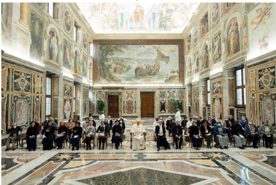
24 janvier 2022 – Salle Clémentine