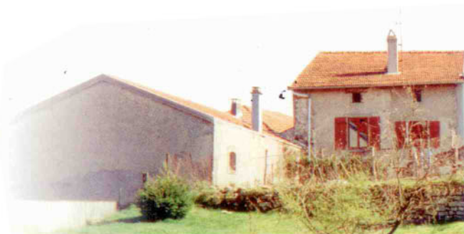
Prvá škola otvorená v Poussay r. 1598