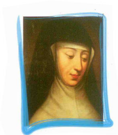
«Pričič sa o jeho rast»